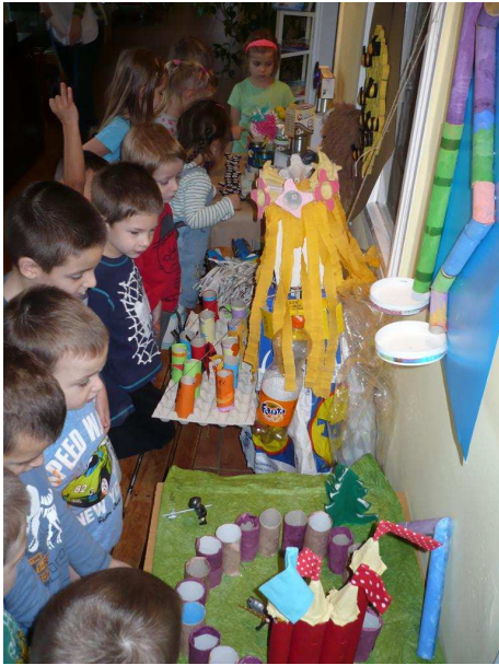
„Európai hulladékcsökkentési hét”